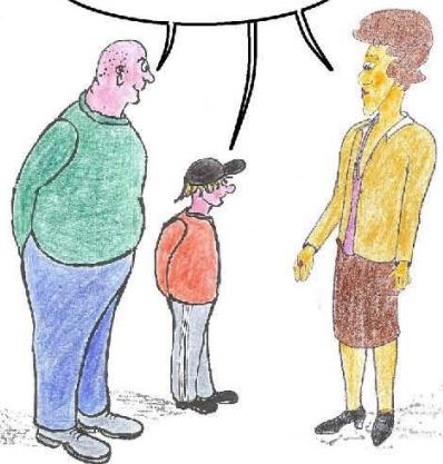
Illustration: JM Tanguy (MGEN)